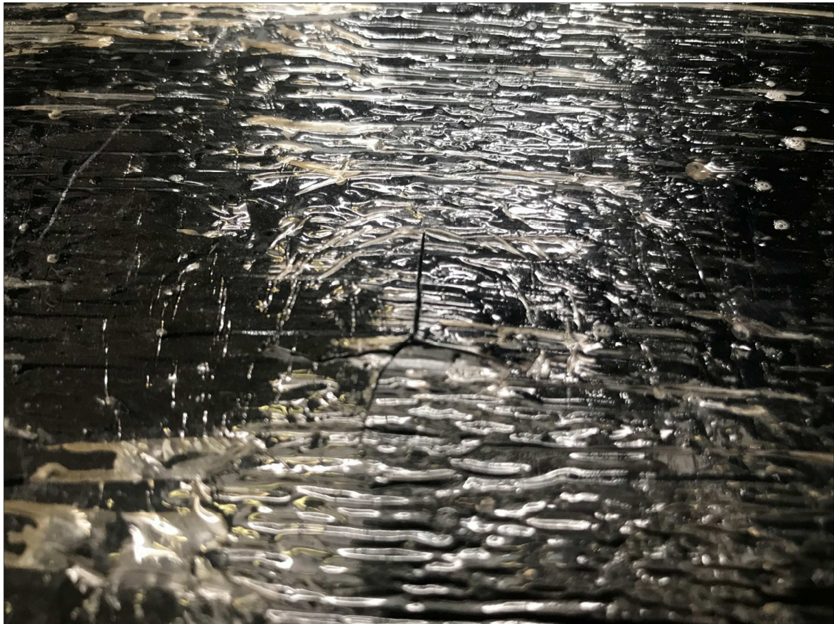
Fotografia di una provetta durante la prova