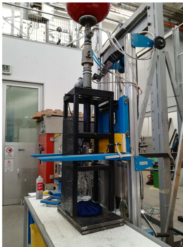
Fotografia di una provetta durante la prova