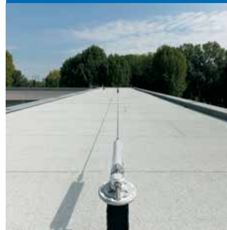
Il rinnovamento dell’edilizia scolastica in Italia: l’esempio della Romagna, Forlì (FC) - Cesena (FC) - Santarcangelo di Romagna (RN)