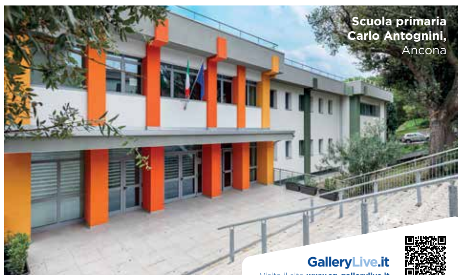
Scuola primaria Carlo Antognini, Ancona

GalleryLive.it Visita il sito www.sg-gallerylive.it