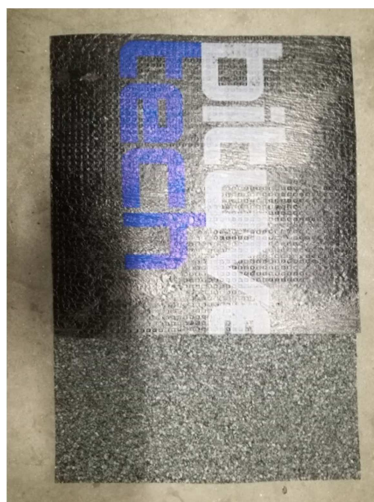
Fotografia di una provetta

Dall'oggetto sono state ricavate, a cura del cliente n. 5 provette, dimensioni 250 mm × 250 mm e spessore uguale a quello di origine.