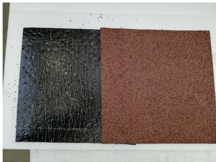
Fotografia di una provetta

Dall'oggetto sono state ricavate, a cura del cliente n. 5 provette, dimensioni 250 mm × 250 mm e spessore uguale a quello di origine.